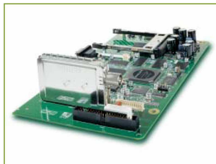
Figuur 1 - IBO+ insteekkaart

Digitale TV is inmiddels een aantal jaren een bekend fenomeen. Ontvangst via de satelliet, de kabel, en sinds kort ook via de ether. Het totale omschakelproces van analoog naar digitaal zal zeker 10 tot 20 jaren duren. Philips speelt hier op in via set-top boxen, en sinds kort ook middels een digitale insteekkaart voor analoge TV sets. Het project dat voor de realisatie van dit product verantwoordelijk was, is onlangs succesvol afgerond. De achtergronden en de succesformule.